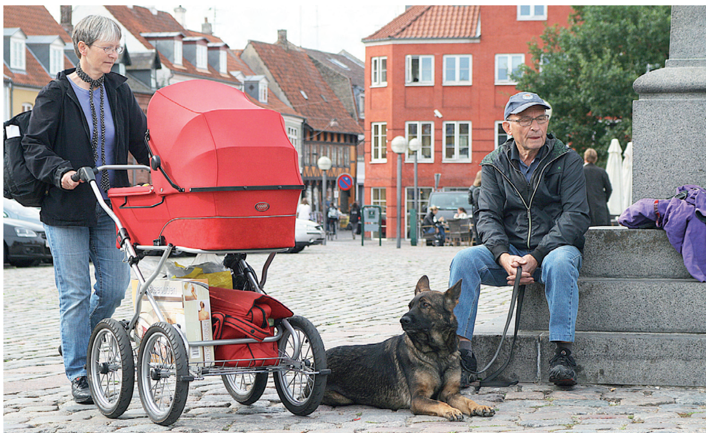
DESIGN & FOTOS: HEIDI TAYMYR 03.2010 © DANSK KENNEL KLUB

sultaterne også skal registreres i DKK, dog indgår disse ikke i raceprofil-gennemsnittet. En hund kan beskrives mere end én gang, men det er det første resultat, der vil blive registreret og indgå i statistikken. Løbske tæver kan deltage, men til sidst. Kastrerede og steriliserede hunde kan ligeledes beskrives. For deltagende hunde skal ejeren på dagen, inden testen begynder, skrive under på, at hunden har en til lejligheden dækkende ansvarsforsikring. Alle bestemmelserne for mentalbeskrivelse kan ses på DKKs hjemmeside.