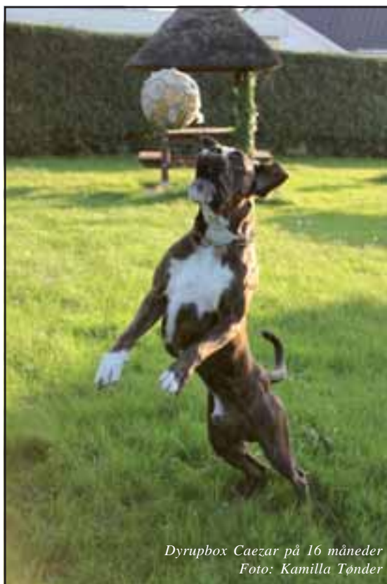
Dyrupbox Caesar på 16 måneder