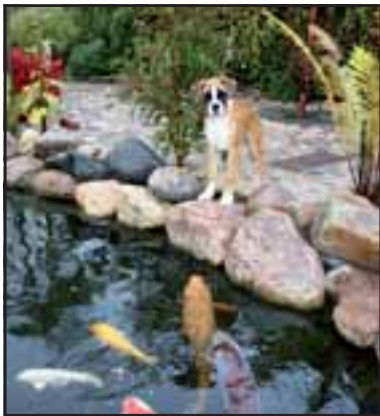
Forside: Chinoki's Maxima (Nala)

Færdige annoncer skal leveres som PDF fil.