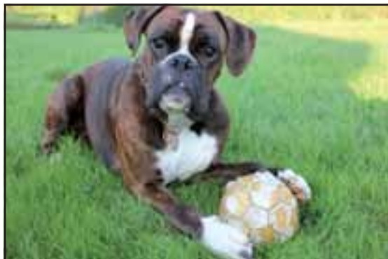
Dyrupbox Caezar

Nedennævnte har opnået Boxer-klubbens årsnål for uafbrudt medlemskab: