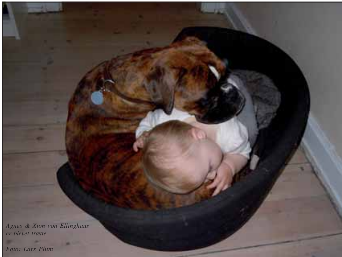
Agnes & Xton von Ellinghaus er blevet trætte.