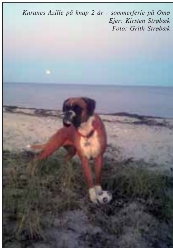
Kuranas Azille på knap 2 år - sommerferie på Omø Ejer: Kirsten Strøbæk