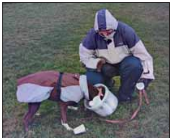
Foderet i sne- og isskoster: Foderet er gemt i en spand med eengangskrus, der rasler og larmer.

Foderet var nogle steder landet i dyb sne, andre steder mellem is- og sneklumper. Det lå øverst på klippehylder eller i dybe spækker. Nogle steder måtte de sågar ernære sig af døde isbjørne, moskusokser og sæler.