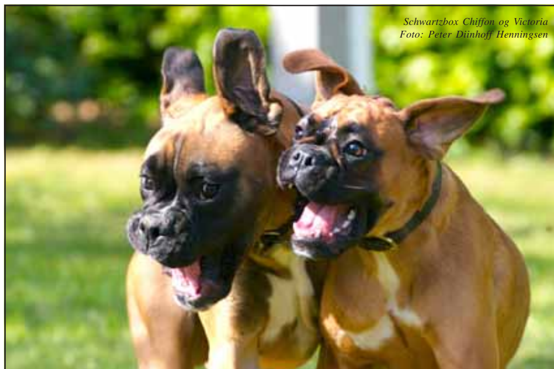
Schwartzbox Chiffon og Victoria

På den måde får vi en mulighed for at vide, hvad det præcis er, der er foregået, og vi kan skaffe os et samlet overblik over, hvor det "halter".