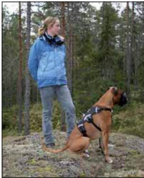
Schwartzbox Chiffon på vandretur i Sverige