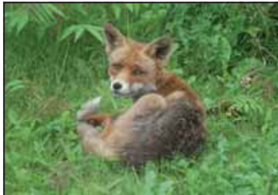
Ræven er typisk smittebærer for hjerteorm. Foto: Jan Anderschou. Øvrige fotos og illustrationer er fra KVL.

Hvis man har stillet diagnosen hjerteorm, skal hunden behandles med et ormemiddel. Fenbendazoler, f.eks. Panacur® er effektive midler. Behandlingen skal gentages en 2-3 gange med 10 dages mellemrum.