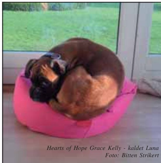
Hearts of Hope Grace Kelly - kaldet Luna