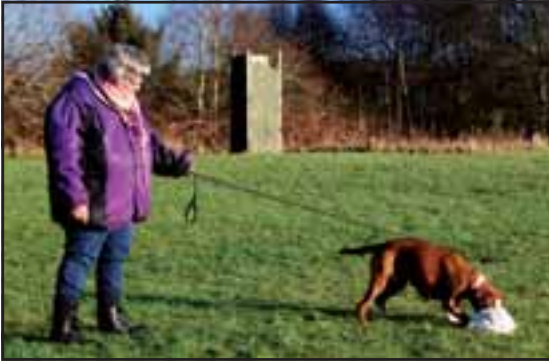
Døde dyr: Foder er gemt i en gammel moppe eller kost.