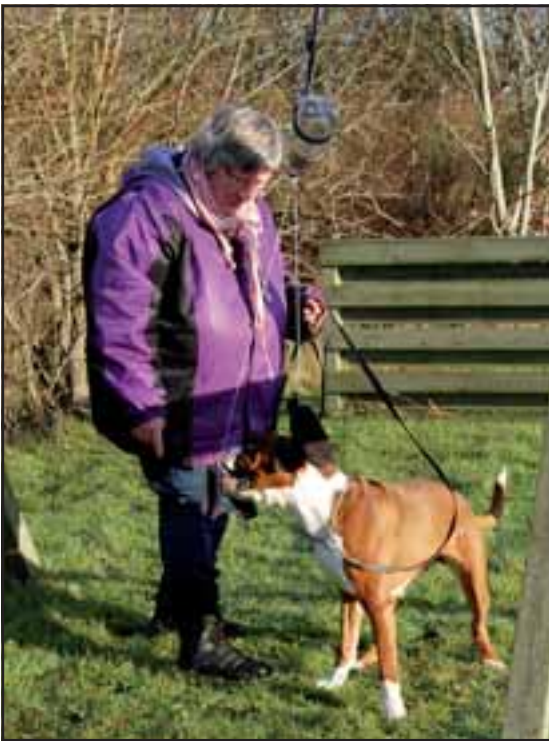
Foder på klippehylder: Foderpiller er hældt i en sodavandsflaske, der er hængt op i en snor med åbningen vendt lidt opad. En snor er bundet om flaskehalsen og et par sokker i enden af snoren frister hunden til at trække i den. På den måde, vipper flasken og foderet drysser ud.

Langt om længe så de et lys i mørket, og det viste sig, at det stammede fra et sølle skjul. Gruppens tobenede håbede på, at de kunne skaffe hjælp i skjulet, men de stakkels boxere var så udmattede, at de ikke magtede at slæbe sig et skridt videre. Men dødsforagt efterlod gruppens medlemmer de udmattede hunde for at skaffe den fornødne hjælp og kæmpede sig de sidste hundrede meter til skjulet. I skjulet sad den ulykkelige Julemand med sin