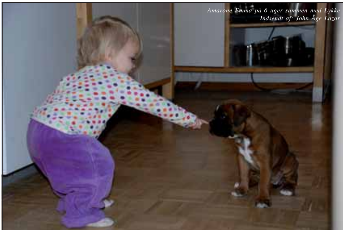
Amarone Emma på 6 uger sammen med Lykke Indsendt af: John Åge Lazar