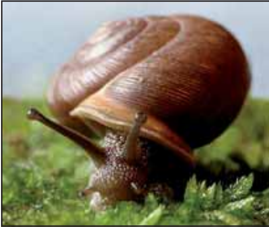
Snegle fungerer som mellemvært.