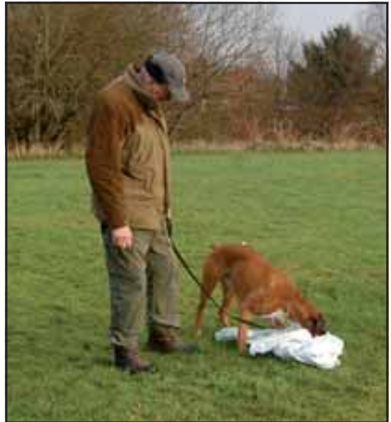
Foderet i snemasser: Foderet, uanset type, er viklet ind i gamle lagner eller dynebetræk.

De stakkels hunde måtte kæmpe sig igennem sne- og ismasserne og leve af den føde, de kunne finde.