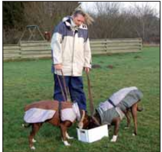
Foderet er gemt i en kasse med gamle kødben, træstumper, legedyr.

Se, det er et rigtigt juleeventyr, som det kun kan opleves ved Gruppe Viborgs juleafslutning. Desuden har de grønlandsrejsende deltagere fundet en god måde at aktivere hundene på. For det er jo ret sjældent, at vore boxere er så udmattede, at de næppe kan røre sig.